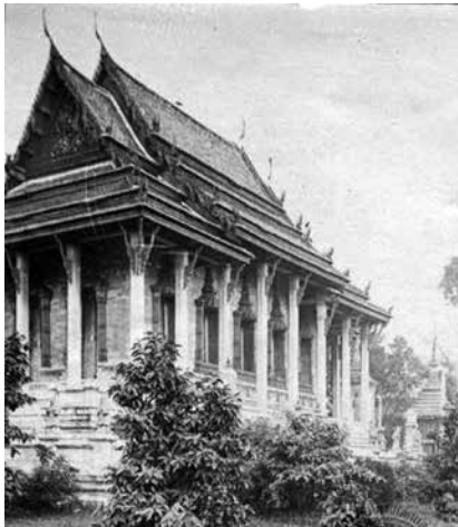
ภาพที่ 10 ภาพถ่ายเดิมของพระพุทธรัดนสถานในพระบรมมหาราชวัง