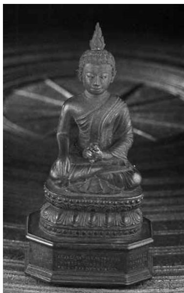
ภาพที่ 8 พระชัยนวโลหะ