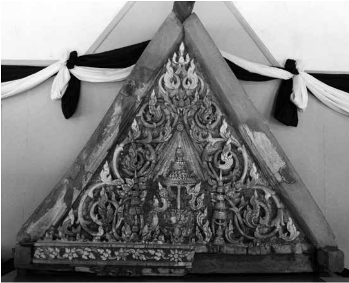
ภาพที่ 5 หน้าบันเดิมของพระวิหารน้อยปัจจุบัน ตั้งจัดแสดงอยู่ ณ ประชาสัมพันธ์ (ทิมดาบ) (ที่มา: หอจดหมายเหตุแห่งชาติ กรมศิลปากร)