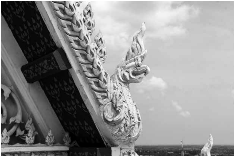
ภาพที่ 4 นกเจ้า-ปูนปั้นนาคปากครุฑ และใบระกาแบบลวดลายอย่างเทศ