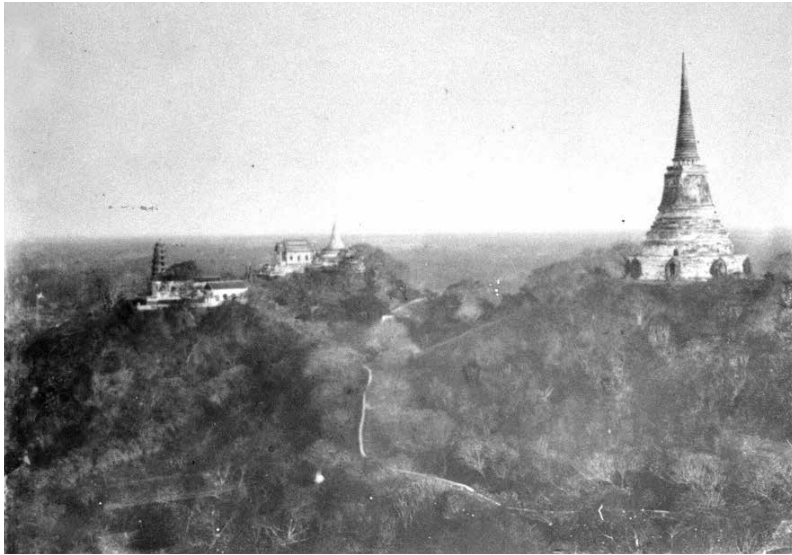
ภาพที่ 1 เขตพุทธสถานบนยอดเขาลูกกลางและยอดเขาทางทิศตะวันออก