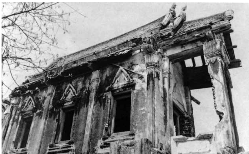
ภาพที่ 7 สถาปัตยกรรม (น้อย) ก่อนการบูรณะ