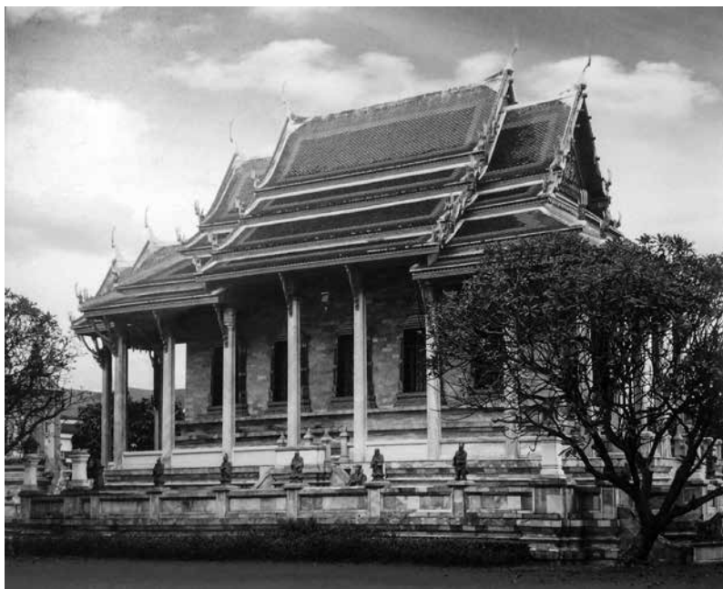
ภาพที่ 11 รูปแบบทางสถาปัตยกรรมพระพุทธรัดนสถาน