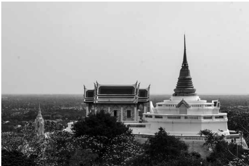
ภาพที่ 2 ตำแหน่งที่ตั้งของหอรชฆัง, พระวิหาร (น้อย) และพระสุทธเสลเจดีย์