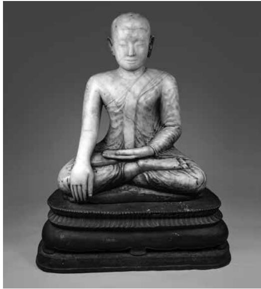
ภาพที่ 3 พระศิลาอ่อน