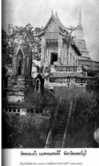
วัดพระแก้ว บนพระนครคีรี จังหวัดเพชรบุรี

(ในฉบับพิมพ์ ค.ศ. ๑๙๖๘ ภาพในสารราชวาทานำ ๑๓๑-๑๓๒)