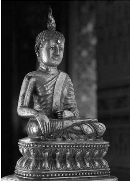
ภาพที่ 9 พระชัยวัฒน์ (ที่มา: ม.ร.ว. สุริยวุฒิ สุขสวัสดิ์. พระพุทธปฏิมาในพระบรมมหาราชวัง. กรุงเทพฯ: สำนักพระราช เลขาธิการ, 2535)