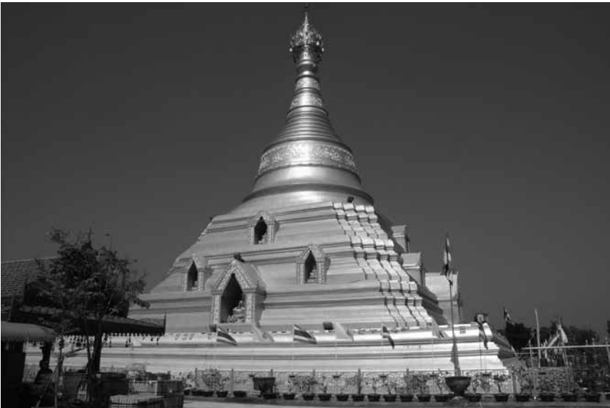
พระบรมธาตุนครชุม สร้างเมื่อ พ.ศ. 1900 โดย สมเด็จพระมหาธรรมราชาลิไท บูรณะใหม่เป็นเจดีย์ทรงพม่า ในสมัยรัชกาลที่ 5

บรรดาหลักฐานทางโบราณวัตถุ และหลักฐานที่เป็นโบราณสถานในพื้นที่ดังกล่าว ก็ล้วนแสดงลักษณะเป็นแบบแผนของชุมชนในสมัยสุโขทัยอย่างชัดเจน ดังนั้นจึงสันนิษฐานว่า เจดีย์วัดพระบรมธาตุนครชุม นั้นคือ เจดีย์ที่บรรจุพระบรมธาตุอันจริงแท้จากลังกาทามที่อ้างถึงในศิลาจารึกนครชุมนั้น แต่เดิมสันนิษฐานกันว่าพระบรมธาตุนครชุมเป็นเจดีย์ในศิลปกรรมแบบสุโขทัย แต่ต่อมาในรัชสมัยพระบาทสมเด็จพระจุลจอมเกล้าเจ้าอยู่หัว รัชกาลที่ 5 ทางรัฐบาลได้อนุญาตให้คหบดีชาวพม่าเข้ามาทำการบูรณะซ่อมแซมและได้รับการซ่อมแปลงรูปเป็นแบบศิลปกรรมพม่าในคราวนั่นเอง