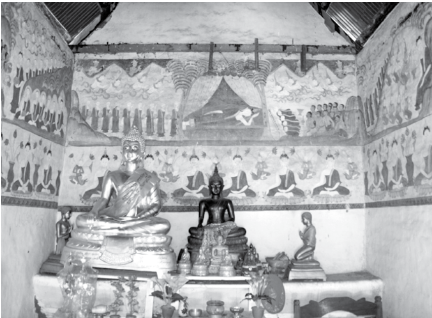
ภาพที่ 3 ภาพจิตรกรรมฝาผนัง เรื่อง พุทธประวัติ ณ สิมวัดป่าเรไรย์ บ้านหนองพอก จ.มหาสารคาม ภาพถ่ายเมื่อวันที่ 17 กรกฎาคม 2553

จิตรกรรมฝาผนังที่วัดโพธารามและวัดป่าเรไรย์ มีเนื้อเรื่องหลักคือ พุทธประวัติ ซึ่งเป็นการถ่ายทอดคติธรรมทางพุทธศาสนา นอกจากนี้ยังมี ภาพวิถีชีวิตเมื่อครั้งอดีตของชาวอีสาน เช่น การแต่งกาย การไว้ผม สภาพ สังคม การทำนา การทอดแหหาปลา การทำบุญ การประกอบอาชีพ การค้าขาย การล่าสัตว์ การขับร้องฟ้อนรำ และประเพณีท้องถิ่นต่าง ๆ เป็นต้น ในภาพจิตรกรรมได้สะท้อนให้เห็นถึงวิถีชีวิตของชุมชนซึ่งถือเป็นเอกลักษณ์ของช่างเขียนชาวอีสาน ที่มักจะสอดแทรกเรื่องราววิถีชีวิตและ