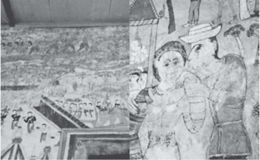
ภาพที่ 5 ความเสียหายอันเกิดจากธรรมชาติ ของภาพจิตรกรรมฝาผนัง วัดโพธาราม ภาพถ่ายเมื่อวันที่ 17 กรกฎาคม 2553

เกี่ยวข้องกับงานดูแลรักษาโบราณสถานเหล่านั้น จากเหตุการณ์ดังกล่าว แสดงให้เห็นว่า ชาวบ้านในท้องถิ่นยังคงมีความเข้าใจที่ไม่ถูกต้องนัก ต่อจุดประสงค์ของกระบวนการมีส่วนร่วมในการรักษามรดกศิลปวัฒนธรรม ทั้งยังก่อให้เกิดความห่างเหินในการปฏิบัติงานระหว่างภาครัฐและท้องถิ่น มากยิ่งขึ้น ท้ายที่สุดผลกระทบจึงเกิดขึ้นโดยตรงต่อตัวทรัพย์สินทาง วัฒนธรรมของท้องถิ่น นั่นคือความเสื่อมสลายของภาพจิตรกรรมฝาผนัง และอาคารโบราณสถานที่ปราศจากการดูแลรักษา ดังนั้นจึงควรมีการ สร้างความเข้าใจเกี่ยวกับภารกิจการถ่ายโอนอำนาจหน้าที่ในการบำรุง รักษา ดูแลรักษาโบราณสถานให้แก่องค์กรปกครองส่วนท้องถิ่นและชาว บ้านในชุมชนต่าง ๆ ได้รับความรอบอย่างทั่วถึง