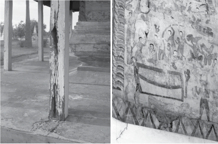
ภาพที่ 6 ความเสียหายของโครงสร้างสถาปัตยกรรม ของวัดป่าเรไรย์ ภาพถ่ายเมื่อวันที่ 17 กรกฎาคม 2553