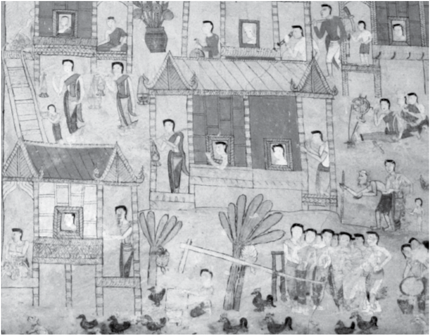
ภาพที่ 4 ภาพจิตรกรรมฝาผนังถ่ายทอดเรื่องราววิถีชีวิตของชาวอีสาน ณ สิมวัดโพธาราม บ้านดงบัง จ.มหาสารคาม ภาพถ่ายเมื่อวันที่ 17 กรกฎาคม 2553

กิจกรรมต่าง ๆ ของชาวบ้านลงไปบนภาพจิตรกรรมฝาผนังด้วยนับได้ว่าวัด ของชาวอีสานเป็นทั้งศาสนสถานและแหล่งเรียนรู้ทางด้านประวัติศาสตร์ สังคมของท้องถิ่นให้แก่คนรุ่นหลังได้เป็นอย่างดี