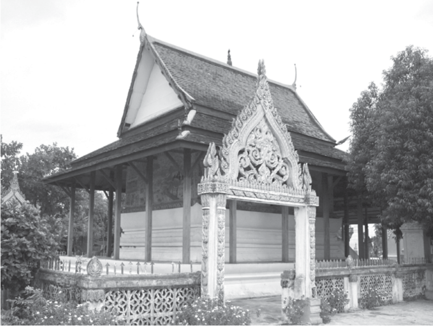
ภาพที่ 1 สิมวัดโพธาราม บ้านดงบัง จ.มหาสารคาม ภาพถ่ายเมื่อวันที่ 17 กรกฎาคม 2553