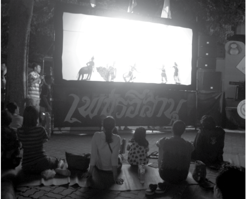
ภาพที่ 8.1- 8.2 การแสดงหนังปะโมทัย ของเยาวชนคณะเพชรอีसान โรงเรียนดงบังพิสัยนวการนุสรณ์ จังหวัดมหาสารคาม ณ ลานกิจกรรมชุมชนสามแพร่ง กรุงเทพมหานคร ภาพถ่ายเมื่อวันที่ 18 ธันวาคม 2553