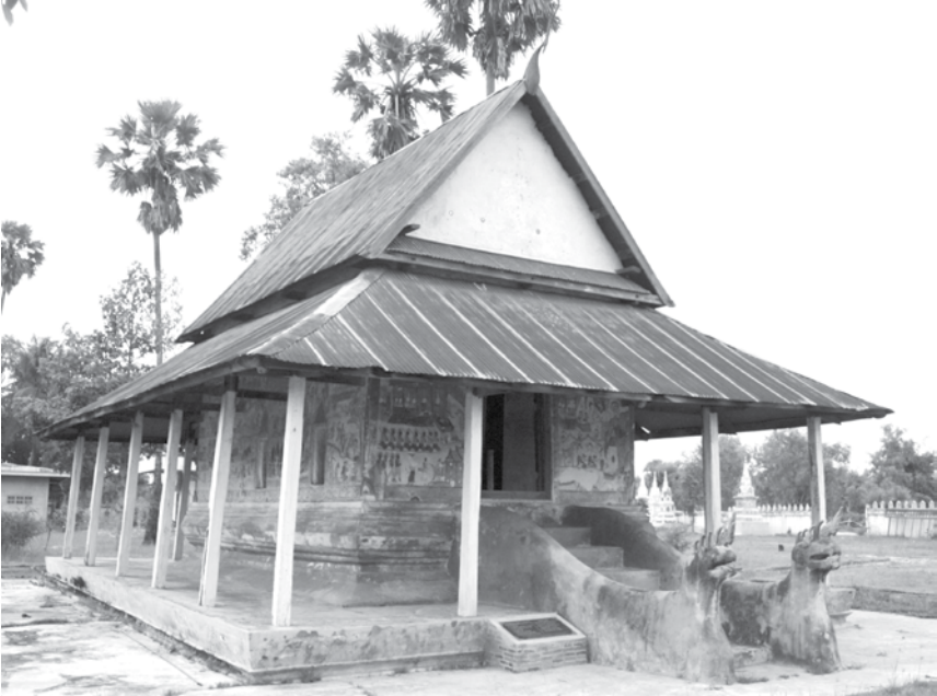
ภาพที่ 2 สิมวัดป่าเรไรย์ บ้านหนองพอก จ.มหาสารคาม ภาพถ่ายเมื่อวันที่ 17 กรกฎาคม 2553