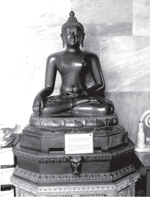
พระสักยสิงห์ พระพุทธรูปในศิลปะล้านนา พระक्रमงคลวิจิตรอัญเชิญมาจากวัดเจติย เมืองเชียงใหม่

สักยสิงห์เป็นองค์ที่ ๑ ๒๖ อีกทั้งเมื่อแรกออกแบบระเบียงควดเบญจมบพิตรฯ ก็ไม่ได้ออกแบบให้พระอุโบสถกับระเบียงติดกัน แต่ได้มีการปรับแบบให้มาเชื่อมต่อกันภายหลัง ๒๗ ซึ่งในประเด็นนี้ก็ชวนให้คิดว่าพระพุทธรูปด้านทิศตะวันออกที่ไม่มีจารึกประดับที่ฐาน ก็เพราะนำมาประดิษฐานในภายหลังการทำจารึก