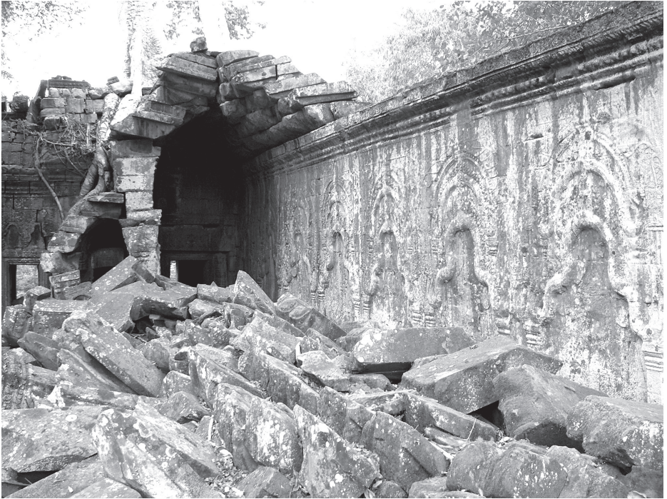
ร่องรอยการแกะสลักซุ้มเรือนแก้วที่ผนังระเบียงคดชั้นนอก ของปราสาทตาพรหมที่เมืองพระนคร