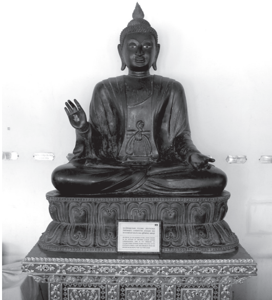
พระพุทธรูปจากเมืองสรรค์