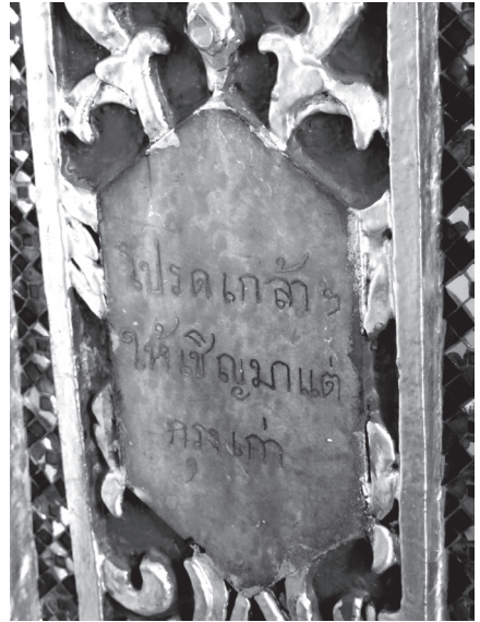
รายละเอียดจารึกที่ฐาน