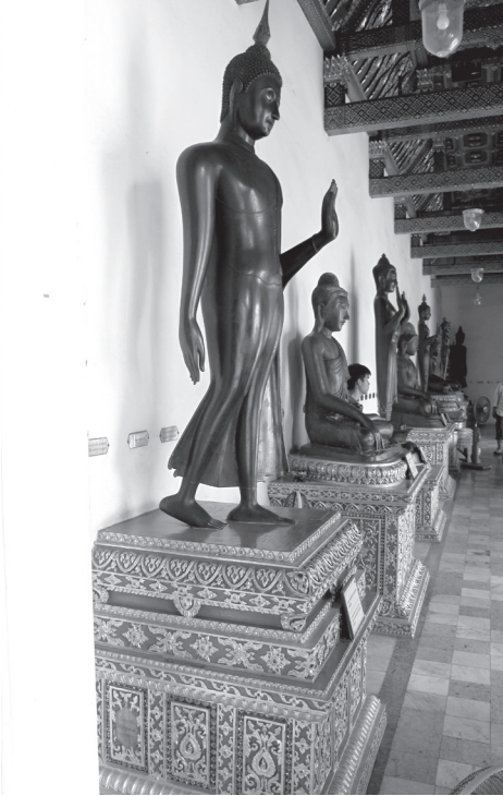
พระพุทธรูปปางลีลาที่ สมเด็จพระยามังคลายุธราชานุภาพ ทรงอธิบายว่ามาจากวัดราชธานี

๓. พระพุทธรูปปางลีลา สมเด็จพระยามังคลายุธราชานุภาพ ทรงอธิบายว่า นำมาจากวัดราชธานี ๑๔ แต่จารึกว่า เชิญมาแต่กรุงเก่า