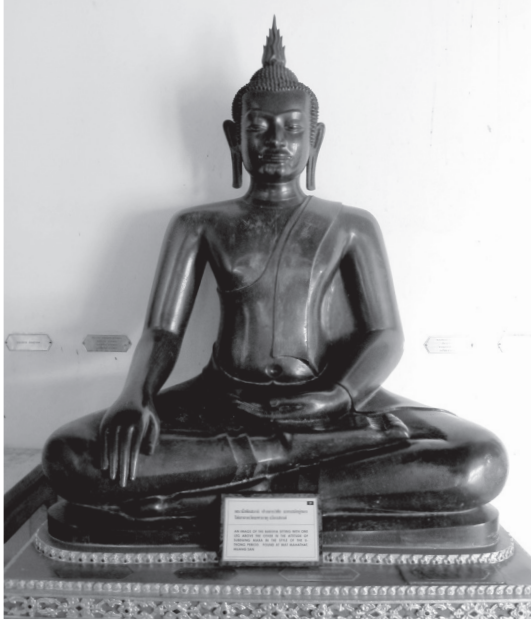
พระพุทธรูปที่เจ้าจอมเอิบหล่อถวาย