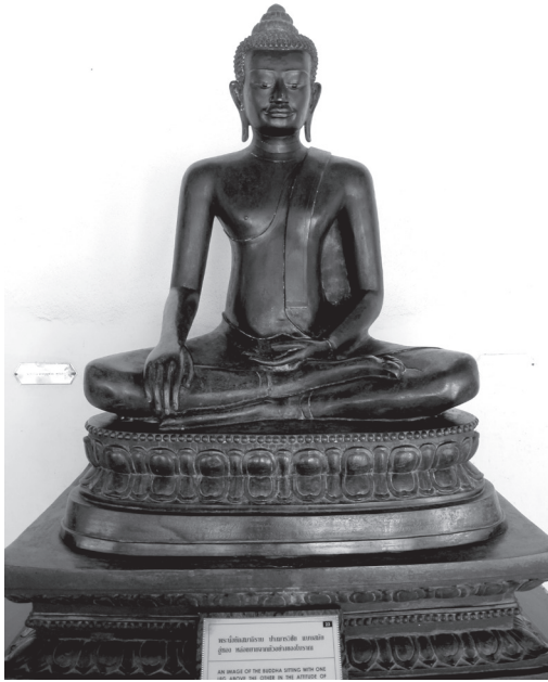
พระพุทธรูปที่สมเด็จพระปิตุจฉาเจ้า สุขุมลมารศรี พระอัครราชเทวี ทรงหล่ออุทิศถวาย เจ้าคุณจอมมารดาสำลี