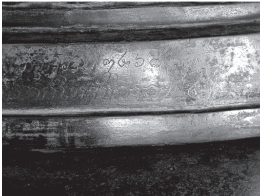
จารึกที่ฐานพระพุทธรูป ระบุปีที่หล่อคือ พ.ศ. ๒๔๖๘