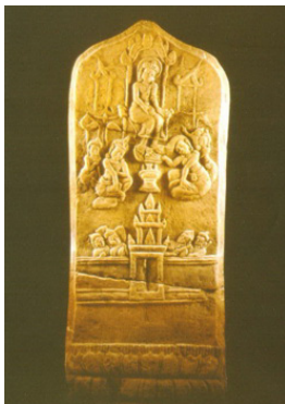
ภาพที่ 2 โบราณหินทรายพิมพ์ปาพิลาป

ขั้นตอนที่ 5 สรุปอัตลักษณ์พิพิธภัณฑ์ จากการศึกษาในครั้งผู้ศึกษาได้อัตลักษณ์พิพิธภัณฑ์ พิพิธภัณฑ์สถานแห่งชาติขอนแก่นใน 2 ลักษณะคือ อัตลักษณ์เดี่ยว คือ โบราณหินทรายพิมพ์ปาพิลาป และอัตลักษณ์กลุ่ม ซึ่งเป็นอัตลักษณ์เชิงนามธรรม คือ ความเป็นพิพิธภัณฑ์ด้านประวัติศาสตร์ โบราณคดีที่มีกลุ่มวัฒนธรรมหรือศิลปะทวารวดีภาคตะวันออกเฉียงเหนือที่มีความโดดเด่นในพื้นที่ภาคตะวันออกเฉียงเหนือระหว่างราวพุทธศตวรรษที่ 12-16 และมีโบราณหินทรายเป็นศิลปกรรมที่เป็นหลักฐานที่สำคัญในวัฒนธรรมหรือศิลปะทวารวดีภาคตะวันออกเฉียงเหนือ โดยมี โบราณหินทรายพิมพ์ปาพิลาปเป็นโบราณวัตถุชิ้นหลักของกลุ่มวัฒนธรรมและเป็นอัตลักษณ์เดี่ยวของพิพิธภัณฑ์สถานแห่งชาติขอนแก่น