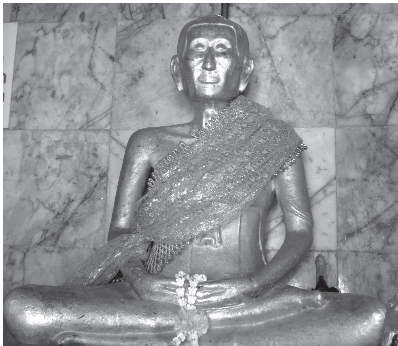
ภาพที่ 3 รูปสมเด็จพะสังฆราช (สุก ไก่เดือน) ที่วัดราชสิทธิาราม

กันว่า “ท่านขรัวตอ” เนื่องจากปั้นลตพระปรางตอเข้าไปจะให้เหมือนพระองค์พวกเจ้านายยังทรงพระเยาว์ติดกับพระพักตร์พระอื่น 7