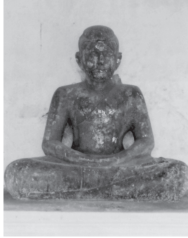
ภาพที่ 7 รูปนายเรื่องผู้เฒ่าตัว ภาพที่ 8 รูปนายนกผู้เฒ่าตัว

อนึ่ง การเฒ่าตัวเพื่อเข้าสำเร็จโพธิญาณนี้เป็นการทำตามความเชื่อเรื่องอนาคตพุทธ ตามที่ปรากฏในคัมภีร์อนาคตวงศ์ ซึ่งมีเนื้อหาเกี่ยวกับพระอนาคตพุทธเจ้า 10 พระองค์ ก่อนที่จะเข้าสู่พุทธภูมิได้บำเพ็ญบารมีในระดับอภุกฤษฎ์ เช่น พระเมตไตรย (อชิต) บำเพ็ญบารมีโดยการตัดเศียรบูชาพระนิพพาน 13 พระรามโพธิสัตว์ บำเพ็ญกุศลด้วยการเฒ่าตัวบูชาธรรมเทศนา 14 พระนารทะ