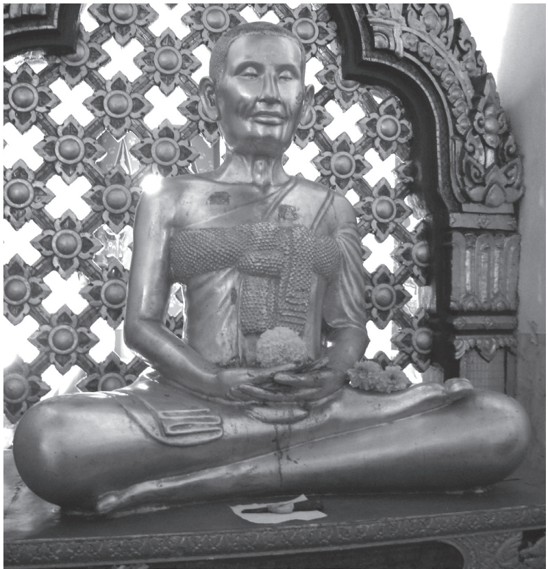
ภาพที่ 5 รูปสมเด็จพระสังฆราช (สุก ไก่เถื่อน) ที่วัดมหาธาตุยุวราชรังสฤษฎ์

รูปแบบของรูปเหมือนที่วัดมหาธาตุยุวราชรังสฤษฎ์คล้ายกับที่วัดราช สิทธิารามแต่มีความสมจริงกว่า พระเศศาทำเป็นเม็ดพระศกเล็กๆ พระขนง ทำอย่างสมจริง ไม่ได้โค้งหรือเป็นเส้นตรงเหมือนกับพระขนงของพระพุท ธรูป พระกรรมสันกว่ารูปที่วัดราชสิทธิาราม พระปรางตอบและมีรอยย่น ส่วนพระวรกายเหมือนกับที่วัดราชสิทธิารามคือพระศอ พระอังสา แสดง กล้ามเนื้อเหมือนจริง ยกเว้นพระขงค์และพระบาทที่เรียบ ไม่แสดงกล้ามเนื้อ เนื้อ จีวรแสดงการห่มดองเหมือนกันแต่เป็นริ้วแบบธรรมชาตินมากกว่าที่วัด ราชสิทธิาราม (ภาพที่ 5)