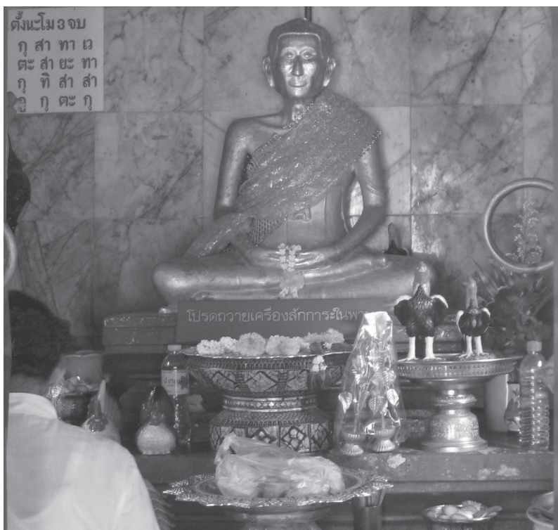
ภาพที่ 12 การถวายของแก่รูปหล่อของสมเด็จพระสังฆราช (สุก โกลิเถื่อน) ที่วัดราชสิทธาราม