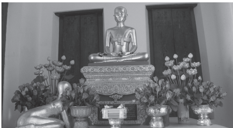
ภาพที่ 11 การถวายดอกไม้บูชารูปของสมเด็จพระพุทธโฆษาจารย์ (ขุน) ที่วัดโมลีโลกยาราม