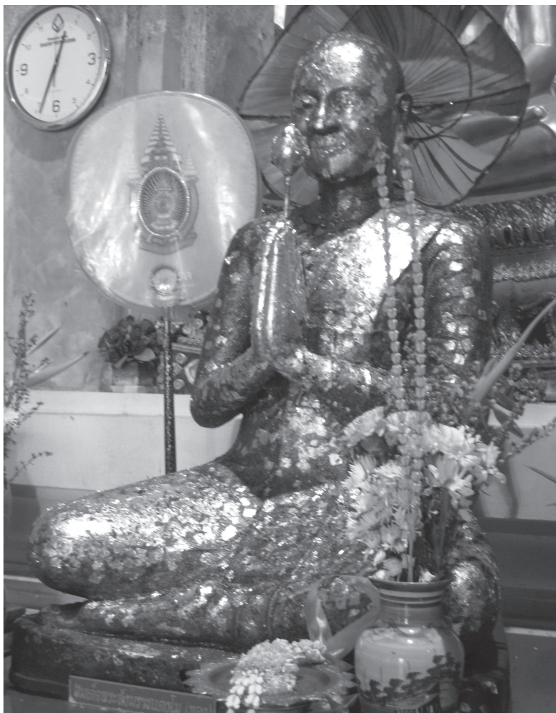
ภาพที่ 6 รูปสมเด็จพระเจ้าตากสินมหาราช ที่วัดใหญ่สุวรรณาราม จ.เพชรบุรี

ครุฑ...” 9 (ภาพที่ 6) ลักษณะดังกล่าวเทียบได้กับรูปเหมือนของสมเด็จพระสังฆราช (สุก ไก่เถื่อน) ที่วัดมหาธาตุยุวราชรังสฤษฎ์