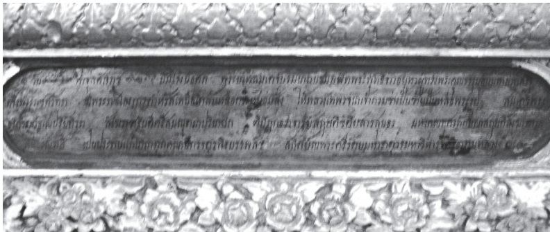
ภาพที่ 4 คำจารึกที่ฐานรูปสมเด็จพระสังฆราช (สุก ไก่เถื่อน) ที่วัดมหาธาตุยุวราชรังสฤษฎิ์