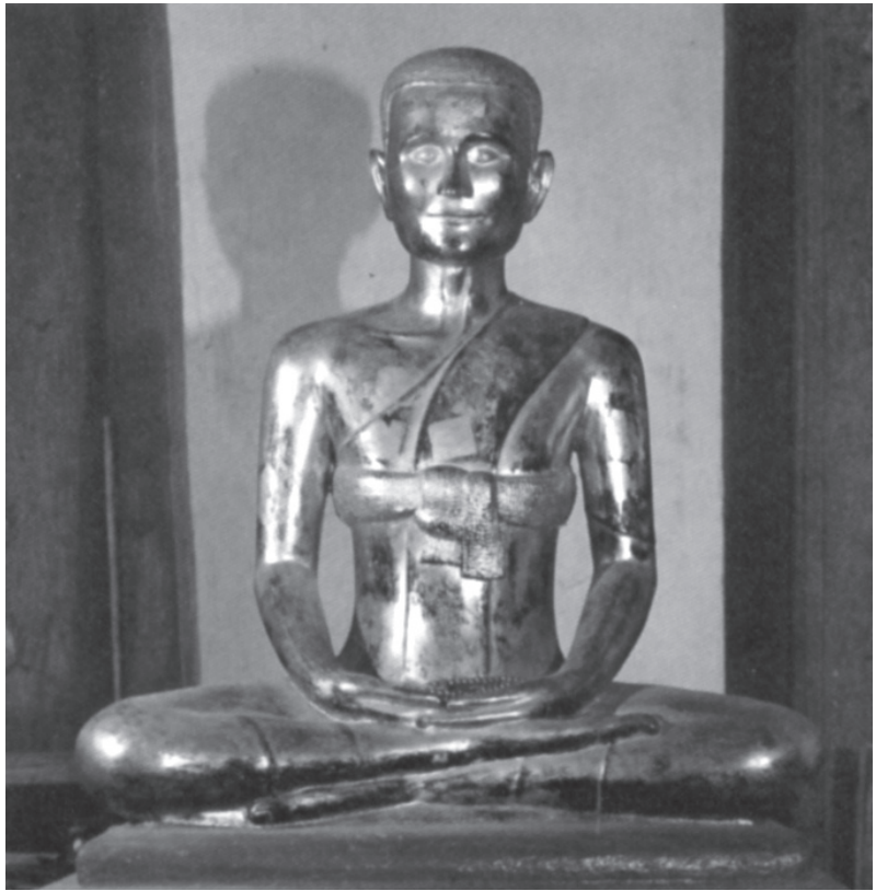
ภาพที่ 2 รูปสมเด็จพระพุทธโฆษาจารย์ ที่วัดโมลีโลกยาราม