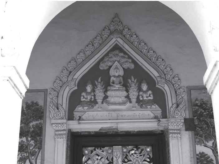
ภาพที่ 4 กรอบซุ้มบันแถลงด้านบนประตูทางเข้า ฝีมือช่างพื้นถิ่น ตัวอย่างที่วัดบุญญานุสรณ์ อำเภอหนองวัวซอ จังหวัดอุดรธานี