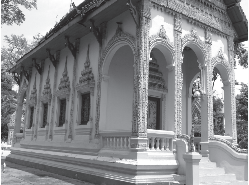
ภาพที่ 6 ผังแบบมุขหน้า-หลัง ยังคงสืบเนื่องที่วัดโนนนิเวศน์ อำเภอเมือง จังหวัดอุดรธานี