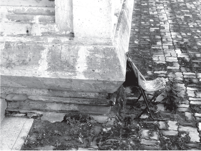
ภาพที่ 7 ฐานจมลงดินเห็นเค้าโครงฐานบัวลูกแก้วอกไก่ ที่วัดบุญญานุสรณ์ อำเภอหนองวัวซอ จังหวัดอุดรธานี