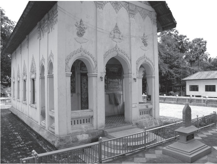
ภาพที่ 8 กรอบวงโค้งอิทธิพลช่างฉวนประดับลายแข่งสิงห์แบบไทย ตัวอย่างที่วัดบุญญานุสรณ์ อำเภอหนองวัวซอ จังหวัดอุดรธานี