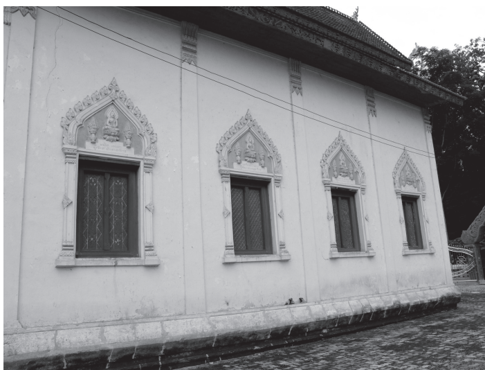
ภาพที่ 2 การแบ่งช่องหน้าต่างระหว่างช่องเสา

ตัวอย่างที่วัดบุญญาสุนทร อำเภอนองวัวซอ จังหวัดอุดรธานี