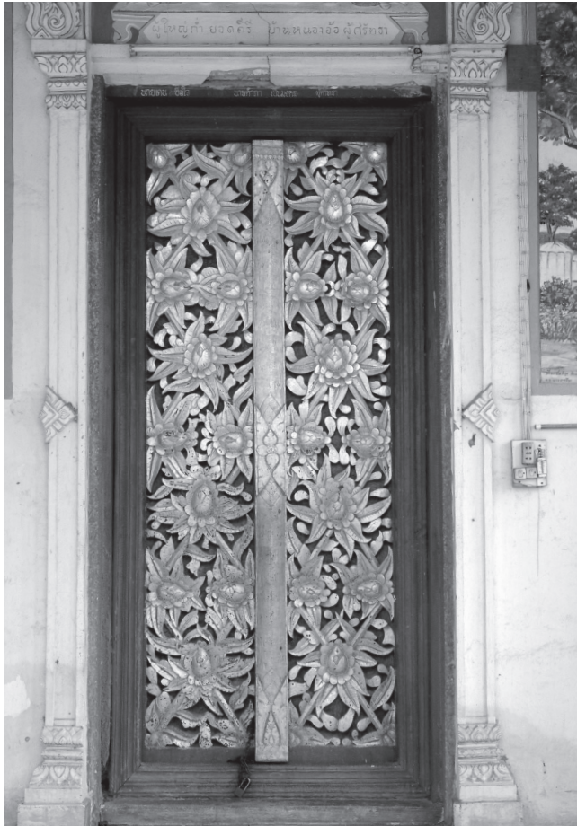
ภาพที่ 9 บานประตูสลักลวดลายดอกไม้ใบไม้พรรณพฤกษา ที่วัดบุญญานุสรณ์ อำเภอหนองวัวซอ จังหวัดอุดรธานี