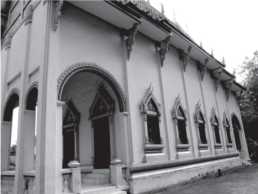
ภาพที่ 5 การแบ่งช่องหน้าต่างระหว่างช่องเสาตัวอย่างที่วัดสว่างสามัคคี อำเภอเมือง จังหวัดอุตรธานี