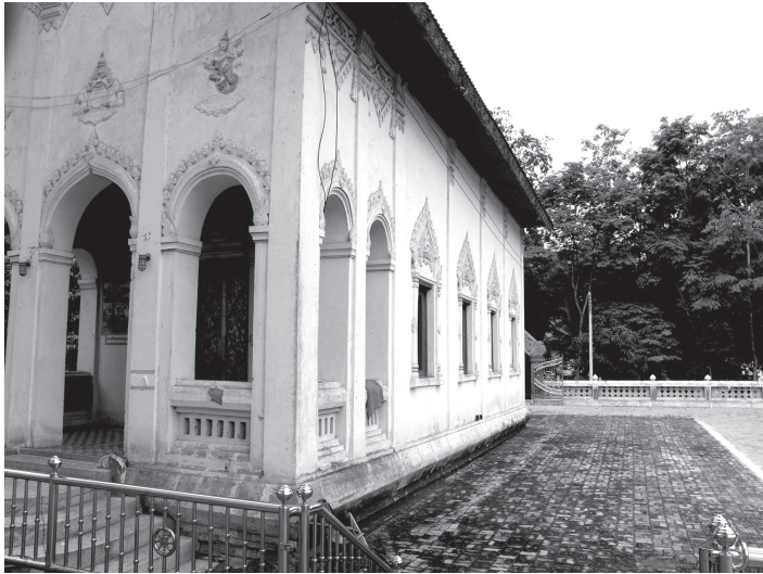
ภาพที่ 3 การใช้ผนังรับน้ำหนักเป็นแบบอิทธิพลฝีมือช่างญวน จึงไม่นิยมประดับคันทวย ตัวอย่างที่วัดบุญญานุสรณ์ อำเภอหนองวัวซอ จังหวัดอุดรธานี