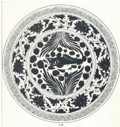
ภาพที่ 16 ภาพปลานบนเครื่องถ้วยสมัยราชวงศ์หยวน

ถึงแม้ภาพปลาว่ายท่ามกลางพีชน้ำจะนิยมต่อมาในสมัยหลัง แต่เห็นได้ว่าการจัดวางองค์ประกอบภาพมีความแตกต่างกัน ในสมัยราชวงศ์หยวนนั้นภาพปลานิยมจัดวางองค์ประกอบภาพเต็มพื้นที่ (ภาพที่ 16) แต่ในสมัยราชวงศ์หมิงนั้นแต่ละองค์ประกอบเช่นปลา และพีชน้ำมีขนาดเล็กลงเป็นอย่างมาก (ภาพที่ 17) ทั้งนี้สำหรับไหที่ได้จากป้อมเพชรนั้น ภาพปลา และพีชน้ำมีขนาดใหญ่ทำให้เต็มพื้นที่ภาชนะ ซึ่งแสดงให้เห็นว่าโหลายครามชิ้นนี้น่าจะทำขึ้นในสมัยราชวงศ์หยวน