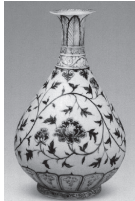
ภาพที่ 11 ลายดอกโบตั๋นบนเครื่องถ้วยสมัยพระเจ้าหงู่ราชวงศ์หมิง