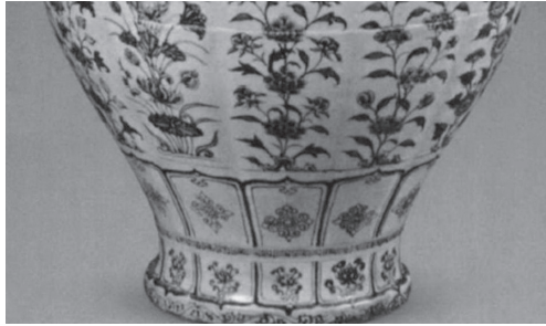
ภาพที่ 13 ลายบัวบนเชิงภาชนะสมัยพระเจ้าหงู่ ราชวงศ์หมิง ที่มา : 高阿申《明洪武青花瓷的呈色研究》, 图6.