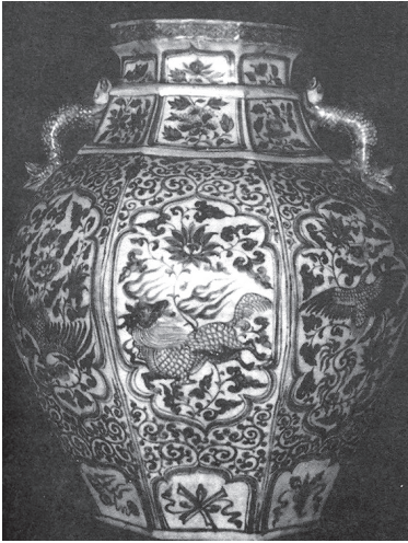
ภาพที่ 5 ไหทรงแปดเหลี่ยม วัดพระธาตุศรีบุญชัย จังหวัดลำพูน ที่มา : อนุรักษ์ภัทร จันทวิช, เครื่องถ้วยจีนที่พบ จากแหล่งโบราณคดีในประเทศไทย, รูปที่ 3.213.