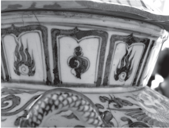
ภาพที่ 14 ลายสัญลักษณ์มงคลในกليبบัว จากเครื่องลายครามเวียงท่ากาน

ช่างสมัยราชวงศ์หยวนนิยมประดับสัญลักษณ์มงคลแปดประการไว้ในช่อกลิปบัว โดยไม่มีกฎเกณฑ์ที่ตายตัว ทั้งนี้มักนำภาพหอยสังข์ซึ่งมาจากสัญลักษณ์ในพระพุทธศาสนามาประดับร่วมกับสัญลักษณ์มงคลแปดประการกลุ่มอื่นๆ นอกจากนี้ อาจสังเกตได้ว่ารูปทรงของสัญลักษณ์มงคลเหล่านี้มักใช้เส้นและรูปทรงที่ไม่ประณีต (ภาพที่ 15) ลักษณะเช่นนี้ปรากฏบนเครื่องถ้วยจากเวียงท่ากานด้วย (ภาพที่ 14)