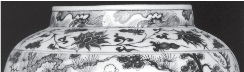
ภาพที่ 7 ภาพลายดอกบัวบนเครื่องลายครามสมัยราชวงศ์หยวน

ลายดอกบัวบนเครื่องถ้วยจีนสามารถแบ่งได้สองประเภท ประเภทแรกคือเขียนภาพกอบัวตามแบบธรรมชาติ แบบที่สองคือการเขียนแบบลายดอกบัวประดิษฐ์โดยจัดเป็นลายก้านขด และเขียนใบไม้ปลายแหลมขอบหยักแทนใบบัวแบบธรรมชาติ (ภาพที่ 7)