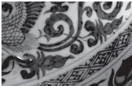
ภาพที่ 9 ลายใบไม้บนเครื่องถ้วยลายครามจากเวียงท่ากาน