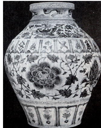
ภาพที่ 4 ไหทรงกลม วัดพระธาตุหริภุญชัย จังหวัดลำพูน ที่มา : ณีฎฐวิภัทร จันทวิช, เครื่องถ้วยจีนที่พบจากแหล่งโบราณคดีในประเทศไทย, รูปที่ 3.214.