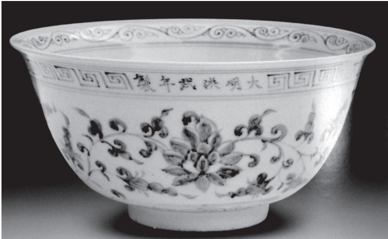
ภาพที่ 8 ลายกลีบบัวบนเครื่องถ้วย สมัยราชวงศ์หมิง

สำหรับใบไม้ประกอบลายดอกบัวก้านขดแบบประดิษฐ์ โคนใบเขียนเป็นรูปโค้งคล้ายตัวอักษรซีหันหลังชนกัน เหนือขึ้นไปขีดแถบปลายแหลมข้างละหนึ่งถึงสองแฉก ถัดขึ้นไปเป็นปลายใบ การเขียนลักษณะใบประกอบดังกล่าวนิยมมากในสมัยราชวงศ์หยวน (ภาพที่ 7) และยังปรากฏอยู่บ้างในสมัยราชวงศ์หมิงตอนต้นคือราวรัชสมัยของจักรพรรดิหย่งเล่อ (พ.ศ. 1368 – 1968) (ภาพที่ 8) ลักษณะลายแบบนี้ได้พบที่ไหกลมจากรูวัดพระพายหลวง (ภาพที่ 6) และจากเวียงท่ากาน (ภาพที่ 9) ดังนั้นจากการพิจารณาลายใบไม้ที่พบอาจกำหนดเครื่องถ้วยทั้งสองใบไว้ในช่วงราชวงศ์หยวน – ราชวงศ์หมิงตอนต้น