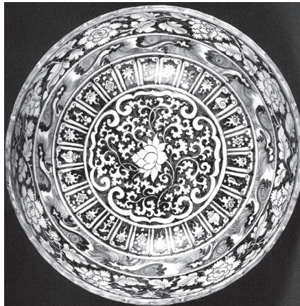
ภาพที่ 15 เครื่องลายครามสมัยราชวงศ์หยวน ที่มา : John Carswell, Blue and White , Fig.8a.)

ช่างสมัยราชวงศ์หยวนนิยมประดับสัญลักษณ์มงคลแปดประการไว้ในช่อกลิปบัว โดยไม่มีกฎเกณฑ์ที่ตายตัว ทั้งนี้มักนำภาพหอยสังข์ซึ่งมาจากสัญลักษณ์ในพระพุทธศาสนามาประดับร่วมกับสัญลักษณ์มงคลแปดประการกลุ่มอื่นๆ นอกจากนี้ อาจสังเกตได้ว่ารูปทรงของสัญลักษณ์มงคลเหล่านี้มักใช้เส้นและรูปทรงที่ไม่ประณีต (ภาพที่ 15) ลักษณะเช่นนี้ปรากฏบนเครื่องถ้วยจากเวียงท่ากานด้วย (ภาพที่ 14)