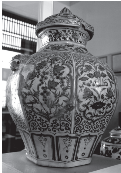
ภาพที่ 1 ไหแปดเหลี่ยม วัดมหาธาตุ จังหวัดพระนครศรีอยุธยา

นักวิชาการได้กำหนดอายุโหลายครามกลุ่มหนึ่งที่พบในแหล่งโบราณคดีไทยไว้ในสมัยราชวงศ์หยวน (พ.ศ. 1823 – 1911) อันได้แก่ไหแปดเหลี่ยมจากวัดมหาธาตุ และไหทรงกลมจากป้อมเพชร จังหวัดพระนครศรีอยุธยา (ภาพที่ 1, 2) ไหทรงกลมจากเวียงท่ากาน จังหวัดเชียงใหม่ (ภาพที่ 3) ไหทรงกลม และทรงแปดเหลี่ยมจากวัดพระธาตุศรีบุญชัย จังหวัดลำพูน (ภาพที่ 4, 5) ไหทรงกลมจากกรุวัดพระพายหลวง จังหวัดสุโขทัย (ภาพที่ 6) 1 อย่างไรก็ตามถึงแม้เคยมีการกำหนดอายุไว้แล้ว แต่กลับไม่เคยมีการกล่าวอย่างชัดเจนว่าองค์ประกอบใดบ้างบนเครื่องถ้วยกลุ่มนี้ที่สามารถบ่งชี้ยุคสมัยได้ จนอาจทำให้เกิดข้อสงสัยกับข้อสันนิษฐานที่ผ่านมา ทั้งนี้ได้กล่าวข้างต้นแล้วว่า การศึกษาลวดลายคือวิธีการสำคัญในการกำหนดยุคสมัย ดังนั้นบทความนี้จึงขอใช้เครื่องมือดังกล่าวเพื่อกำหนดอายุโหลายครามกลุ่มนี้