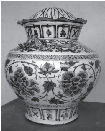
ภาพที่ 3 ไหทรงกลมจากเวียงท่ากาน จังหวัดเชียงใหม่