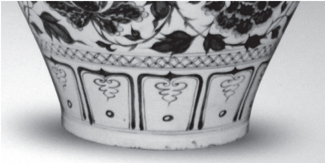
ภาพที่ 12 ลายกลีบบัวบนไหลายครามสมัยราชวงศ์หยวน

อาจสังเกตได้ว่าช่างจีนนิยมเขียนลวดลายไว้ภายในกลีบบัวด้วยโดยอาจเขียนเป็นลายเมฆ พันธุ์พฤกษา หรือสัญลักษณ์มงคล ทั้งนี้สำหรับการเขียนสัญลักษณ์มงคลในลายกลีบบัวนั้น อาจพอสันนิษฐานถึงช่วงเวลาที่เริ่มความนิยมได้ เนื่องจากเครื่องถ้วยที่มีการประดับกลีบบัวลักษณะดังกล่าวหลายใบปรากฏจารึกบอกปีที่ผลิตด้วยโดยจารึกที่พบอยู่ในช่วงปลายพุทธศตวรรษที่ 19 5 ดังนั้นอาจพอสันนิษฐานได้ว่าไหทรงกลมจากเวียงท่ากาน (ภาพที่ 3) และจากวัดพระธาตุหริภุญชัย (ภาพที่ 4) ไม่เก่าไปกว่าช่วงเวลาดังกล่าวด้วย