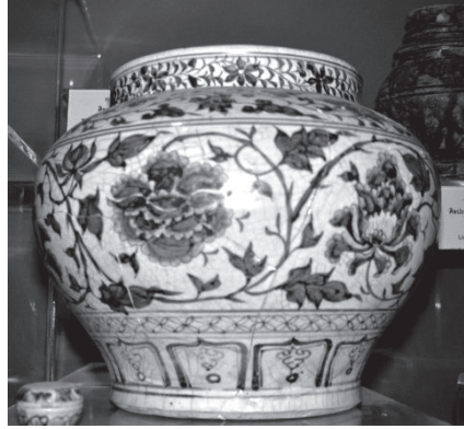
ภาพที่ 6 ไหทรงกลม วัดพระพายหลวง จังหวัดสุโขทัย