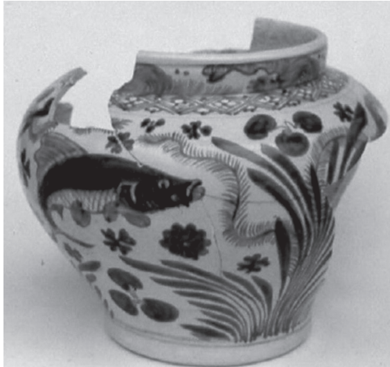
ภาพที่ 2 ไหทรงกลมจากป้อมเพชร จังหวัดพระนครศรีอยุธยา ที่มา : ปวีรรต ธรรมาปริชากร, "การใช้เครื่องถ้วยจีนและเครื่องถ้วยเวียดนามในการกำหนดอายุหลักฐานทางโบราณคดีและศิลปะ: กรณีศึกษาลวดปูนปั้นประดับบนโบราณสถานในประเทศไทยระหว่างพุทธศตวรรษที่ 19-24," ภาพที่ 87.