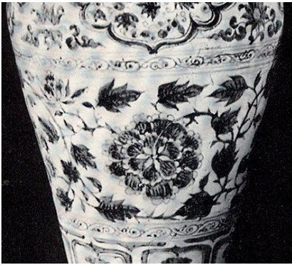
ภาพที่ 10 ลายดอกโบตั๋นจากเครื่องลายคราม สมัยราชวงศ์หยวน

เอกลักษณ์ดอกโบตั๋นในสมัยราชวงศ์หยวนคือการวาดกลีบซ้อนขึ้นไปหลายๆ ชั้น แต่ละกลีบมีการเขียนเส้นขนานที่โคนกลีบเพื่อแสดงความมีมิติ 2 นอกจากนี้ใบไม้ที่ประกอบตัวดอกนั้นมักมีขนาดใหญ่ (ภาพที่ 10) ถึงแม้ว่าการเขียนภาพดอกโบตั๋นซ้อนขึ้นไปหลายกลีบยังปรากฏในสมัยราชวงศ์หมิง แต่การขีดเส้นขนานที่โคนกลีบก็ไม่ปรากฏในสมัยดังกล่าว อีกทั้งตัวดอก และใบไม้ประกอบก็มีขนาดเล็กลงด้วย(ภาพที่ 11) สำหรับลายดอกโบตั๋นที่พบบนไหทรงกลมจากเวียงท่ากาน และวัดพระธาตุหริภุญชัยมีการเขียนกลีบดอกซ้อนกันหลายชั้น ขีดเส้นขนานที่โคนกลีบ และใบไม้มีขนาดใหญ่อันแสดงให้เห็นถึงลักษณะของเครื่องถ้วยในสมัยราชวงศ์หยวนอย่างชัดเจน (ภาพที่ 3, 4)