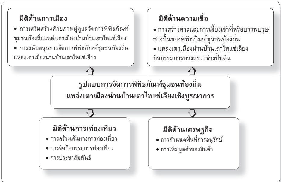
ภาพ : รูปแบบการจัดการพิพิธภัณฑสถานชุมชนท้องถิ่นแหล่งเตาเมืองน่านบ้านเตาไหแช่เสียงเชิงบูรณาการ