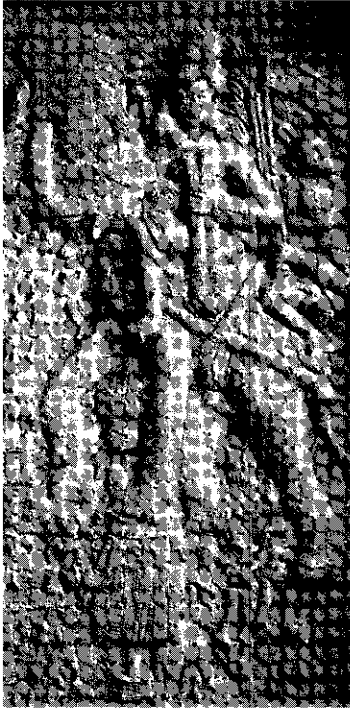
รูปที่ 1 ภาพสลักบนระเบียงของวิหารหมายเลข 19 ที่ ถ้ำเขาควมวันมหาธาตุนทร์ (อินเดียภาคตะวันตกเฉียงใต้) แสดงภาพพระอินทร์ทรงช้างเอราวัณ (พระอินทร์เป็นหัวหน้าเทวดาบนสวรรค์ชั้นดาวดึงส์) ศิลปะอินเดียโบราณ อายุราวพุทธศตวรรษที่ 5