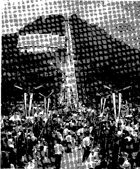
รูปที่ 6 งานตักบาตรเทโว ที่จังหวัดอุทัยธานี มีแถวพระสงฆ์เดินลงบันไดมารับบาตรที่เชิงเขา เป็นการจำลองภาพ "เสด็จลงมาจากสวรรค์ชั้นดาวดึงส์"