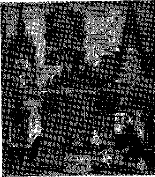
รูปที่ 3 สวรรค์ชั้นดาวดึงส์ มีพระอินทร์เป็นใหญ่ มีช้างเอราวัณ พระจุฬามณีเจดีย์ ธรรมสภาศาลา (ที่ประชุม เทวดา) เวชยันตปราสาทและต้นไม้ทิพย์ (จากสมุดภาพไตรภูมิโบราณ ฉบับกรุงธนบุรี)