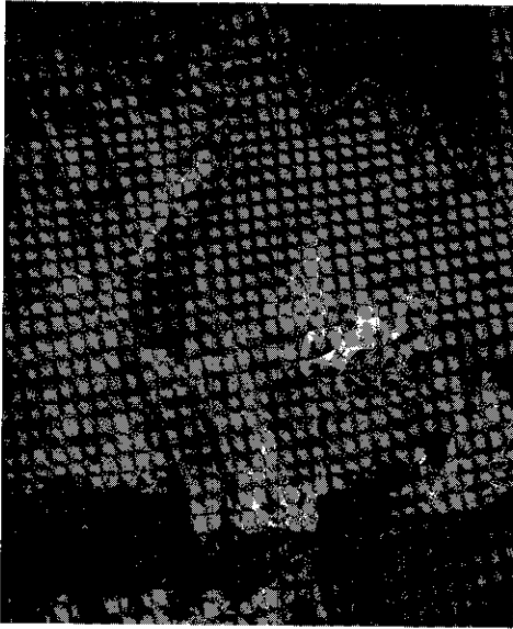
รูปที่ 5 จิตรกรรมฝาผนังในพระที่นั่งพุทไธสวรรย์ แสดงภาพพระพุทธเจ้ากำลังเสด็จลงจากดาวดึงส์ที่พิพิธภัณฑสถานแห่งชาติพระนคร