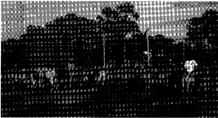
ภาพแสดงเด็กหนุ่มกับการฝึกซ้อมวัดลานในหมู่บ้านช่วงเช้าของวันสุดสีปดาห์