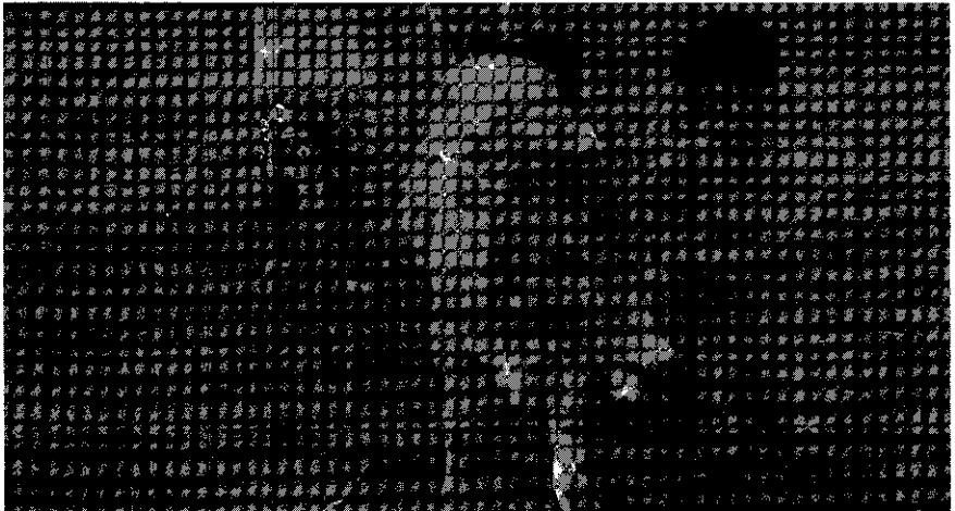
ภาพแสดงเด็กผู้ชายกับ "ของเล่น" ไม้ปูกักและลูกวัว