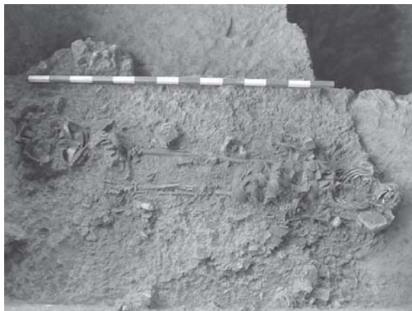
ภาพที่ 1 โครงกระดูกหมายเลข 1 (หลุม D7-8) ชั้นวัฒนธรรมที่ 2 (ชั้นดินที่ 4)

ลำดับพัฒนาการทางสังคมวัฒนธรรมสมัยก่อนประวัติศาสตร์ในพื้นที่ลุ่มน้ำท่าจีน-แม่กลอง