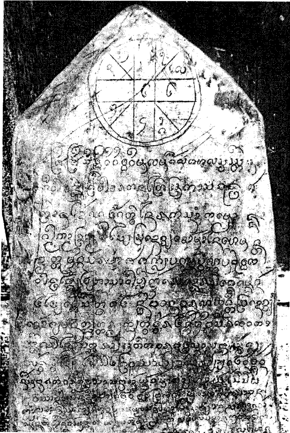
ภาพจารึกน่าน 16 ด้านที่ 1 (บรรทัดที่ 1-14) จารึกเจ้าอัครพรปัญญาเสริมยอดพระธาตุแห่ง