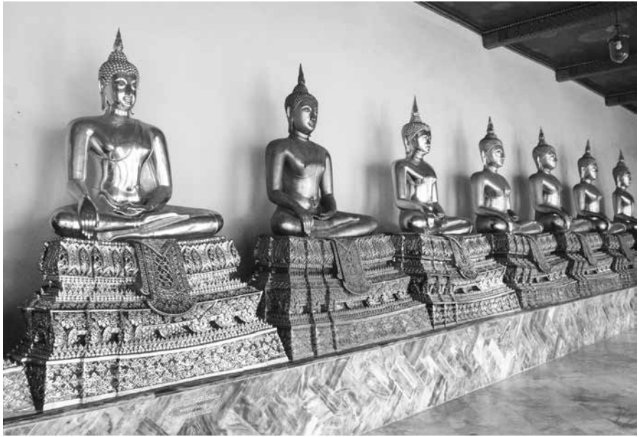
รูปที่ 2 พระพุทธรูปในระเบียบพระอุโบสถชั้นใน วัดพระเชตุพนฯ