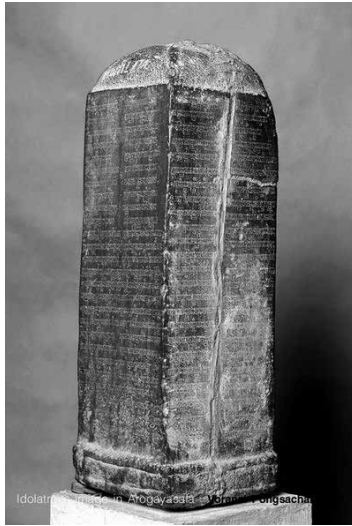
รูปที่ 2 จารึกทรายฟอง พบที่สาธารณรัฐประชาธิปไตยประชาชนลาว