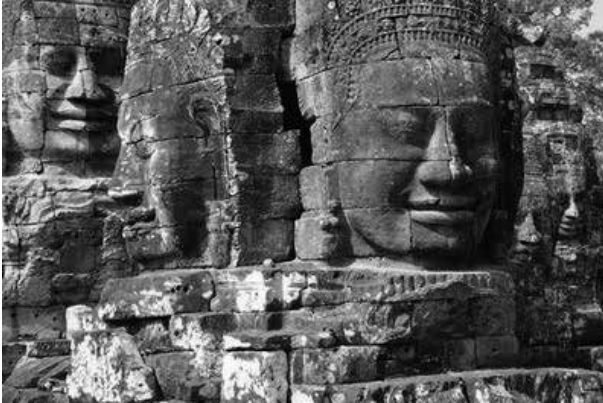
รูปที่ 3 พระพักตร์ที่ปรางค์ยอดปราสาทบายน แม้จะเป็นพระพักตร์ของพระโพธิสัตว์อวโลกิเตศวร แต่ก็แสดงให้เห็นว่าคือพระพักตร์ของพระเจ้าชัยวรมันที่ 7 มหาราชแห่งเมืองพระนครที่ยึดอุดมคติตามแบบอย่างพระโพธิสัตว์