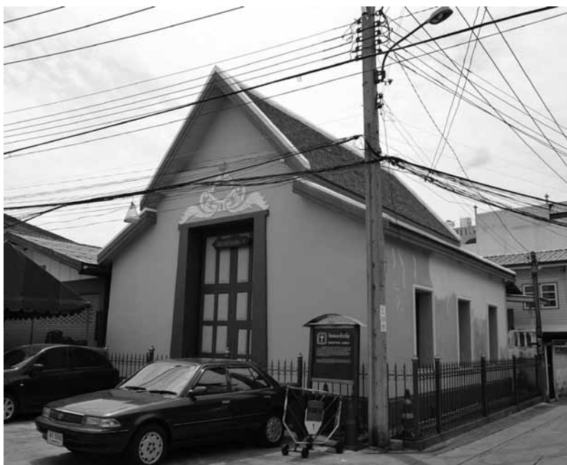
รูปที่ 1 อาคารโบสถ์คอนเซ็ปชันหลังเดิม ปัจจุบันใช้เป็นพิพิธภัณฑ์