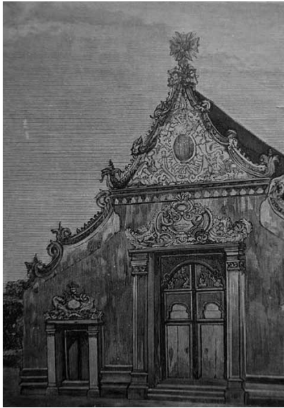
รูปที่ 4 วัดช้างตากูร์สุหลังเดิม