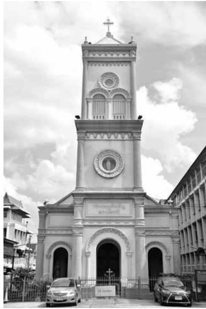
รูปที่ 2 วัดคอนเซ็ปชัญหลังปัจจุบัน