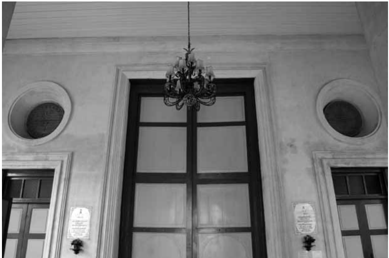
รูปที่ 11 ประตูดอกโบสถ์ที่บริเวณ Narthex ระดับกระຈສီเหนือบานประตู

ส่วน Narthex หรือมุขกระสันที่เชื่อมต่อหอรระฆังหลังใหม่แบบโรมันเนสก์ เข้ากับโบสถ์เก่าทรงวิลันดานั้น ทำให้ Façade หรือสกัดหน้าดั้งเดิมเปลี่ยนแปลงไป แต่เดิมในสมัยที่ยังไม่มีมุขกระสัน มีการเจาะช่องฝาผนังสกัดหน้า และกรูกระຈສီเพื่อรับแสงแดดโดยตรงใน พ.ศ.2402 แต่เมื่อมีการเชื่อมมุขกระสันเข้ากับโบสถ์ ทำให้กระຈສီไม่ได้รับแสงโดยตรงอีกต่อ