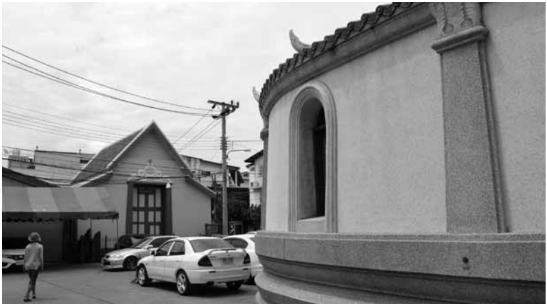
รูปที่ 6 การใช้หัวเสาใบอะแคนทัส กระเบื้องจีน และฐานสิงห์

ผนังภายนอกอาคารนั้นเจาะช่องหน้าต่างโดยรอบ แต่มีการขยายกรอบหน้าต่างให้กว้างขวางขึ้นและเริ่มส่งกระจงกสีเข้ามาประดับเพิ่มเติมในพ.ศ.2402 2 มีการใช้เสาหลอก (Pilaster) ติดผนังประดับอาคารทั้งภายนอกและภายใน หัวเสาเป็นลายใบอะแคนทัส ซึ่งสังเกตได้ว่า เสาลักษณะนี้ยังรักษาเค้าโครงของศิลปะไทยผสมตะวันตก (หรือที่เรียกว่าลาย”อย่างเทศ”) เอาไว้ (รูปที่ 6) ส่วนหลังคาแต่เดิมมุงด้วยกระเบื้องกาบกล้วยแบบจีน สันหลังคาตะเข้ประดับเหงาอย่างจีนเช่นเดียวกัน ดังปรากฏในภาพถ่ายเก่า (รูปที่ 7)