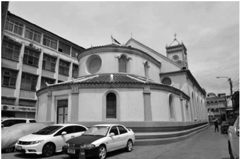
รูปที่ 3 มุขด้านหลังของโบสถ์คอนเซ็ปชัญ เป็นห้องเตรียมพิธีกรรม