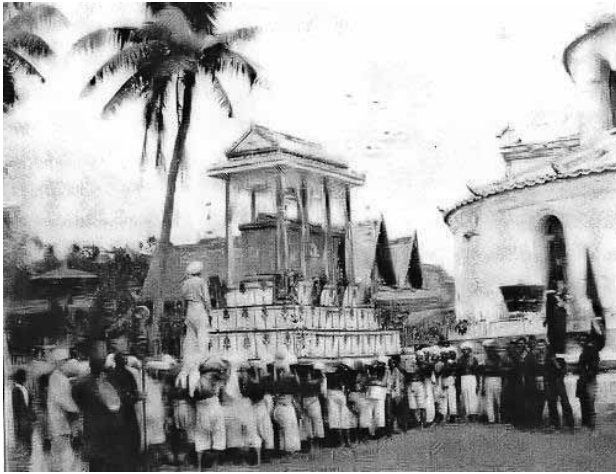
รูปที่ 7 พิธีปลงศพพระสังฆราชปาลเลอกัว เห็นวัดคอนเซ็ปชันด้านหลังใช้กระเบื้องแบบจีน

ดังนั้นจึงอาจสันนิษฐานได้ว่าตัวอาคารวัดคอนเซ็ปชันที่สร้างโดยบาทหลวงปาลเลอกัว ในสมัยรัชกาลที่ 3 น่าจะมีลักษณะสถาปัตยกรรมพื้นเมืองหรือแบบวิลันดา ที่ผสมผสานรูปแบบศิลปะตะวันตกกับช่างไทย จีน และตกแต่งตามทฤษฎีและเทคนิคเชิงช่างที่เอื้ออำนวยในยุคนั้น มากกว่าจะสร้างขึ้นตามสถาปัตยกรรมตะวันตกแท้