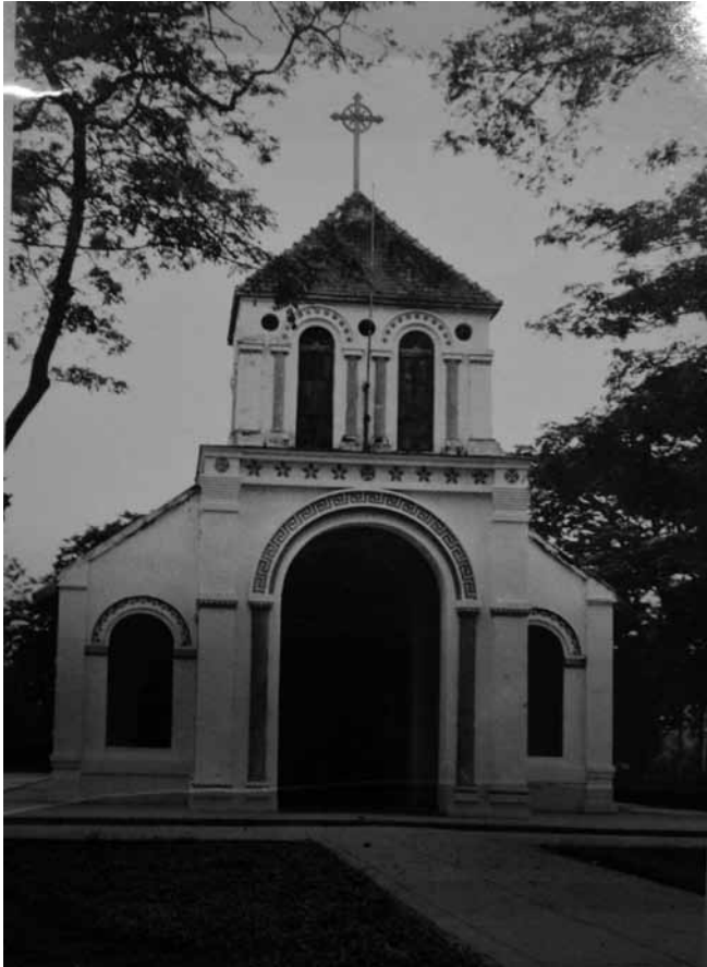
รูปที่ 8 โบสถ์นักบุญเปโตรสามพราน (หลังเก่า)