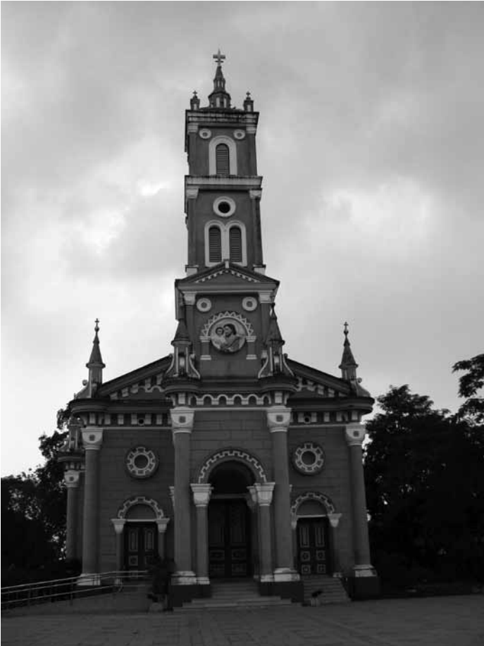
รูปที่ 9 โบสถ์นักบุญยอแซฟ อยุธยา