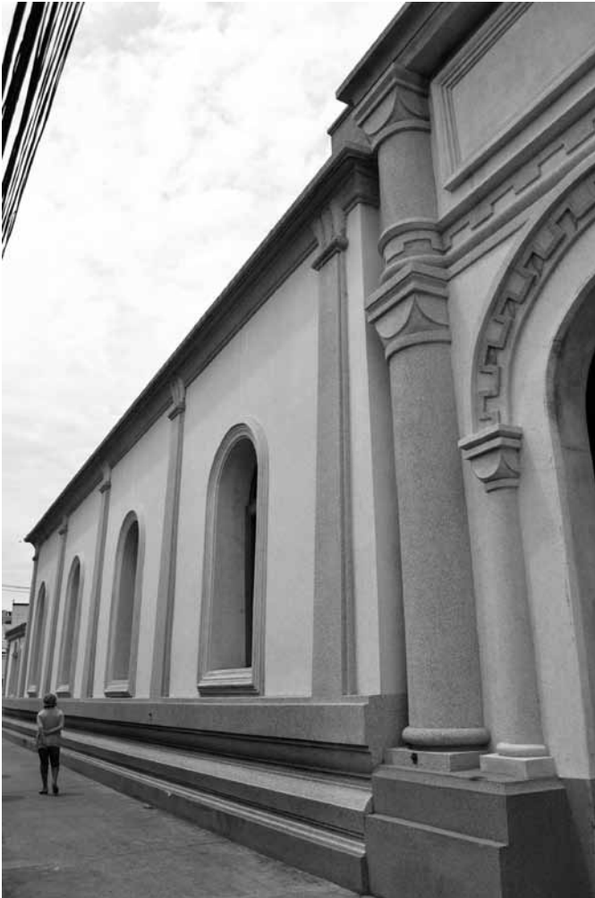
รูปที่ 10 ส่วนต่อขยายของ Narthex ประชิดกับตัวโบสถ์เก่า มีการใช้ระบบฐานและเสาที่แตกต่างกันทั้งแบบไทยและตะวันตกอย่างชัดเจน

มีลักษณะแบบอาคารไทยประเพณี ขณะที่ลวดบัวของหอรระซังนั้น เป็นลวดบัวแบบตะวันตก (รูปที่ 10) และสามารถสังเกตเห็นได้อย่างชัดเจนว่าผนังของตัวโบสถ์มีการเอียงสอบเข้าแบบไทยประเพณี แต่มุขกระสันที่ต่อเติมเข้ามา