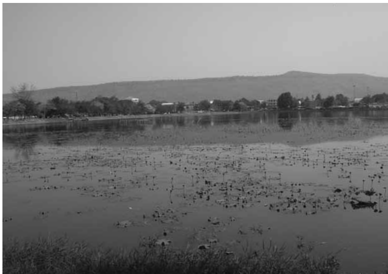
ภาพที่ 1 สภาพภูมิประเทศที่ตั้งเมืองหนองบัวลำภู มีหนองน้ำขนาดใหญ่อยู่ใกล้เชิงเขาภูพานคำ มีกอบัวขึ้นอยู่มาก จนถูกนำมาตั้งเป็นชื่อของเมือง