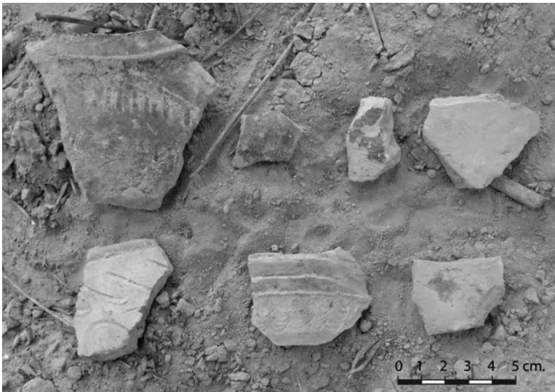
รูปที่ 8 เศษเครื่องปั้นดินเผาแบบเขมรพบที่แหล่งโบราณคดีห้วยหินลับ