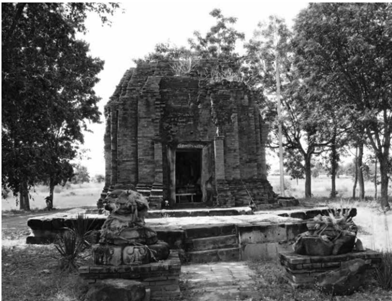
รูปที่ 4 ปรางค์นางผมหอมเป็นศิลปะเขมรแบบบาปวน มีอายุราวพุทธศตวรรษที่ 16-17