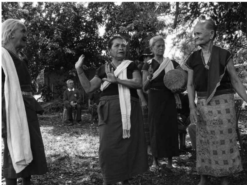
รูปที่ 1 หญิงชาวน้อยกรุงแต่งกายในชุดประจำเผ่ากำลังร้องรำทำเพลง