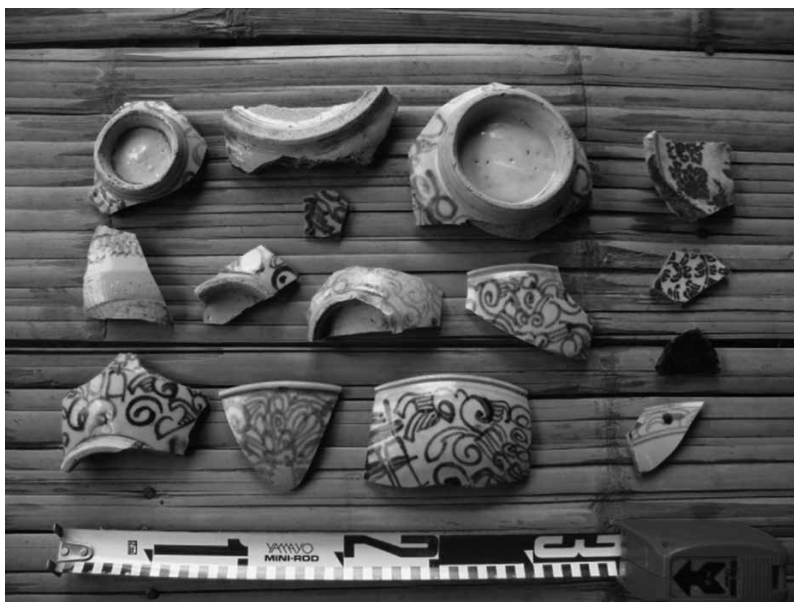
รูปที่ 9 เศษเครื่องปั้นดินเผาจีนสมัยราชวงศ์ซิงพบในแหล่งโบราณคดีบ้านวังอ้ายโพธิ์