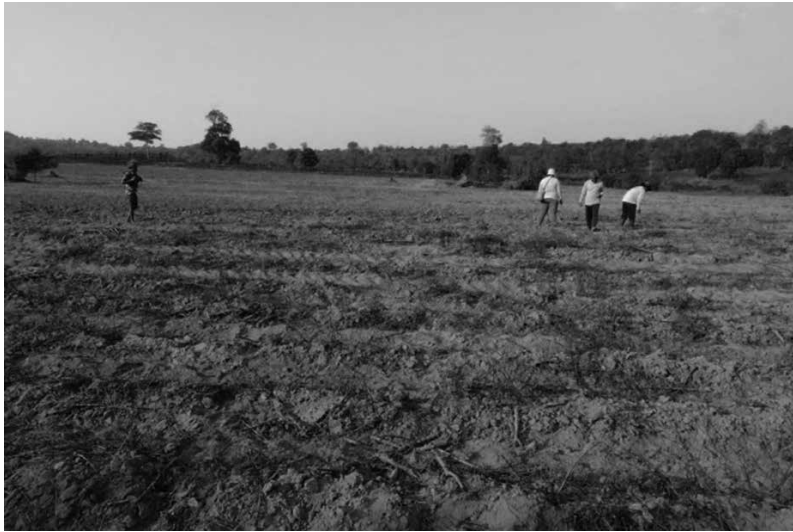
รูปที่ 7 แหล่งโบราณคดีห้วยหินลับ