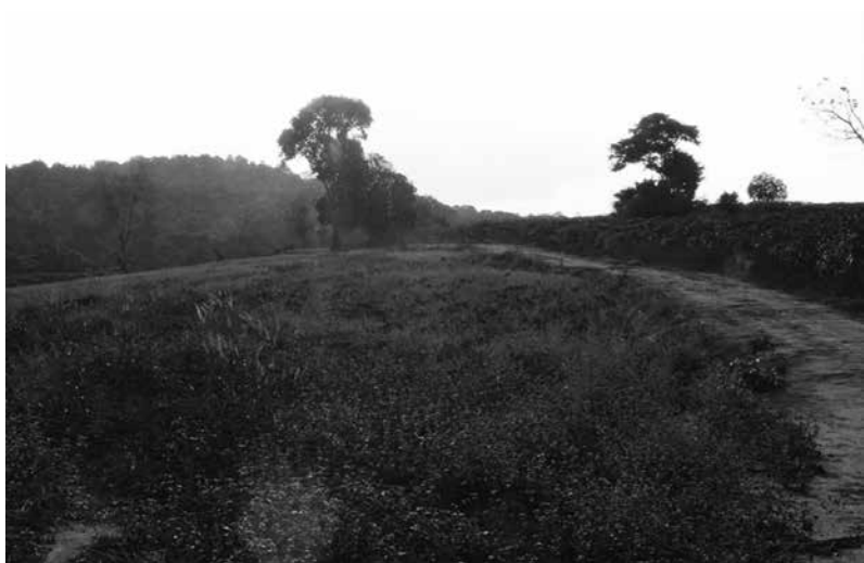
รูปที่ 5 แหล่งโบราณคดีบนเส้นทางเกวียนใกล้ช่องซิด