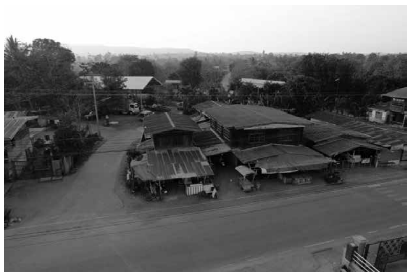
รูปที่ 2 หมู่บ้านไร่ ด้านหลังเป็นแนวเขาพังเหย และช่องซิด