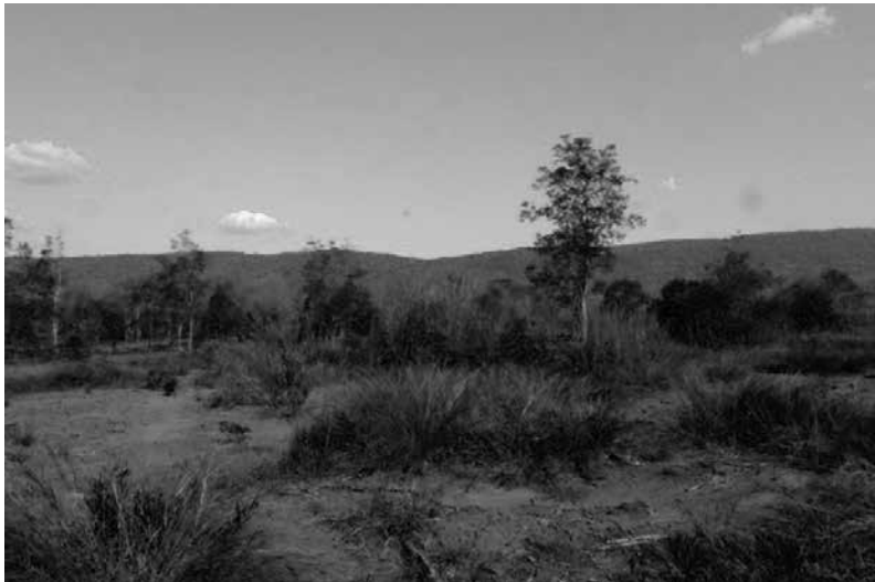
รูปที่ 3 กึ่งกลางของแนวเทือกเขาพังเหยคือช่องซิด ซึ่งเป็นเส้นทางคมนาคมของคนตั้งแต่ในสมัยโบราณ