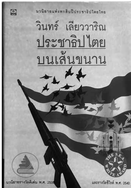
ประชาติปไตยบนเส้นขนาน แต่งโดย วินทร์ เลียววาริณ