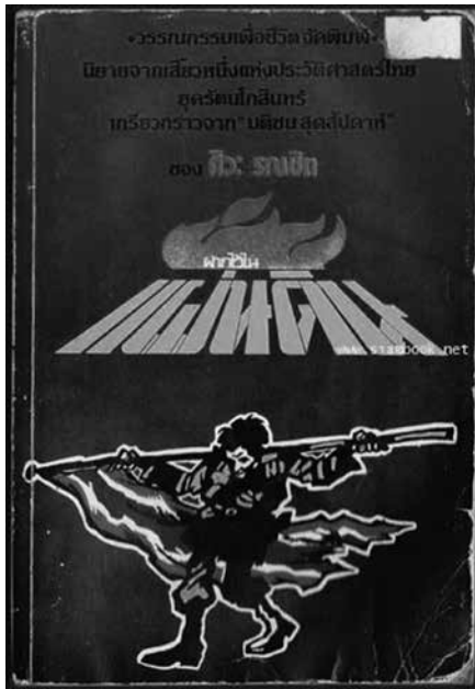
ผากไว้ในแผ่นดิน แต่งโดย ศิวะ รมชิต (สุวัฒน์ วรดิลก)