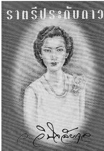
ราตรีประดับดาว แต่งโดย ว.วินัจฉัยกุล (คุณหญิงวินิตา ดิถียนต์)