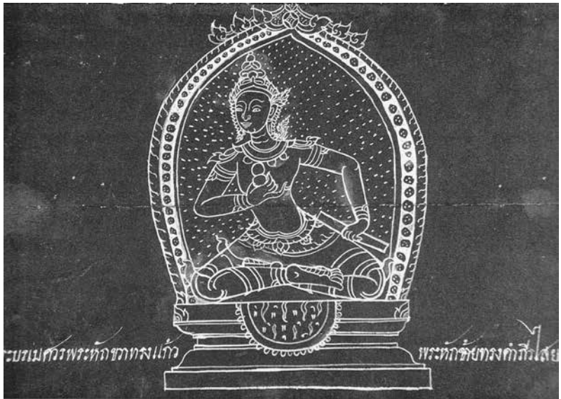
รูปที่ 2 พระบรมศวร ตำราภาพเทวรูป “พระสมุทรูปพระไสยสาตร เลขที่ 33” พระหัตถ์ขวา ทรงแก้ว พระหัตถ์ซ้ายทรงคัมภีร์ไสยศาสตร์