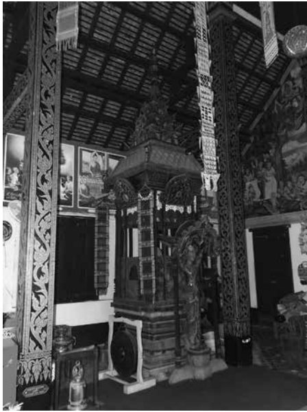
ภาพที่ 3 ร้านธรรม วิหารวัดปงสนุก จังหวัดลำปาง ลักษณะเป็นไม้แกะทาสีประดับกระจกรูปเทวดา สร้างแยกออกมาจากธรรมาสน์