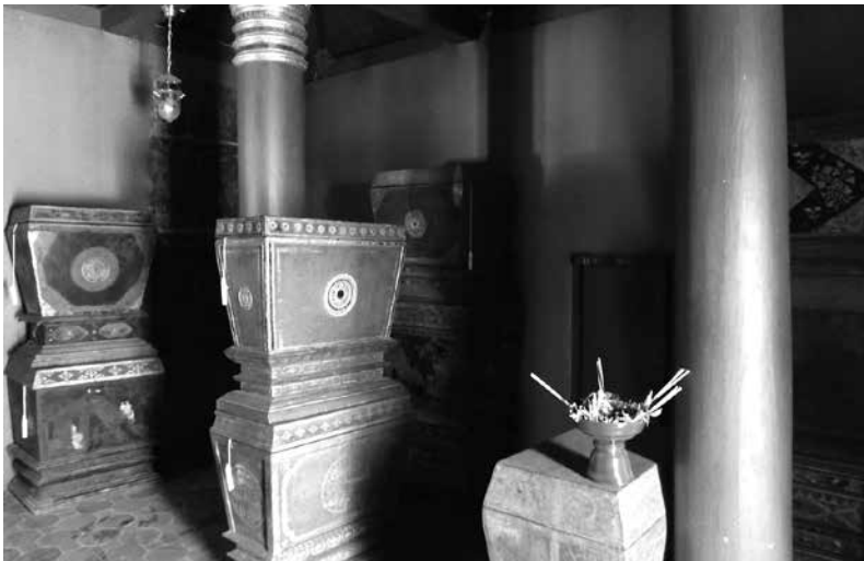
ภาพที่ 4 หีบธรรม ในหอไตรวัดดวงดี อำเภอเมือง จังหวัดเชียงใหม่ ลักษณะเป็นหีบไม้ทรงสูงมีฝาครอบ เขียนลายทองบนพื้นแดง