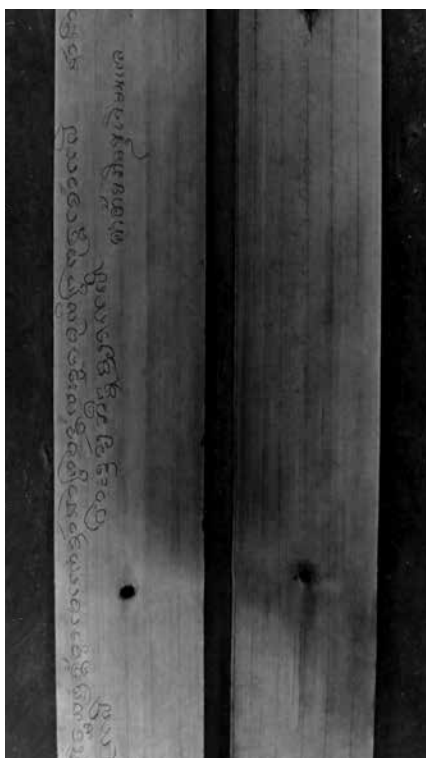
ภาพที่ 1 และ 2 ใบลานอานิสงส์หอไตร วัดพระหลวง อำเภอสูงเม่น จังหวัดแพร่ ขนาด 8 ใบลาน 16 หน้า ในหนึ่งหน้ามี 5 บรรทัด จารด้วยอักษรธรรมล้านนา อักษร ไทย ภาษาบาลี, ภาษาไทยถิ่นเหนือ และ ภาษาไทยปัจจุบัน