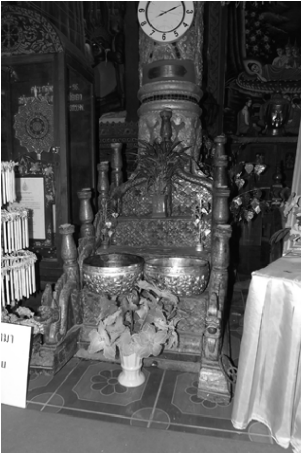
ภาพที่ 7 สัตถภัณฑ์ วัดศรีโสดา อำเภอเชียงของ จังหวัดเชียงราย ลักษณะเป็นไม้แกะ รูปชั้นบันได มี 9 เสา 4 ระดับ ราวบันไดแต่งเป็นนาค ชั้นบันไดแกะลายพันธุ์พฤกษา