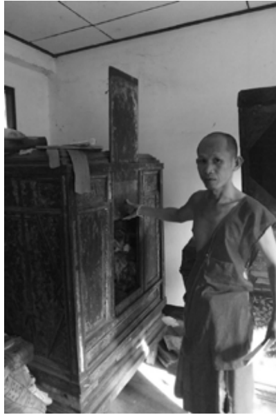
ภาพที่ 5 ทิษธรรม ในกุฏิวัดศาลาลหลวง อำเภอเกาะคา จังหวัดลำปาง ลักษณะเป็นผู้พระธรรมที่มีบ้านประตูเป็นไม้แผ่นเดียวตั้งขึ้นด้านบน