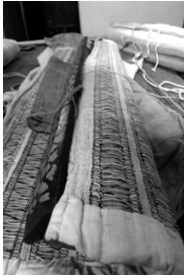
ภาพที่ 6 ผ้าห่อคัมภีร์วัดพระหลวง อำเภอสูงเม่น จังหวัดแพร่ ลักษณะเป็นผ้าฝ้ายที่ใช้สอดไม้ไผ่หรือตอกคั่นโดยตลอด เพิ่มความแข็งแรงให้โครงผ้า และช่วยป้องกันใบลานหัก